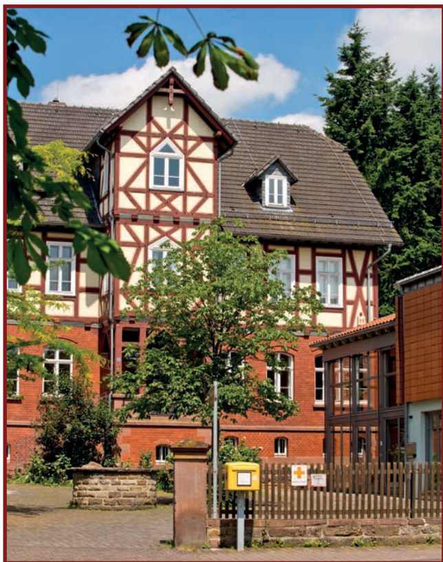
Gerhardt von Reutern-Haus mit Kunsthalle

Bei allen Kursen bitten die Dozentinnen, die Dozenten und die WTB um rechtzeitige Anmeldung.